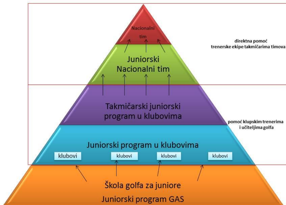
Grafikon 1. Piramidni razvoj amaterskih igrača u Srbiji

Razvojni put amaterskog igrača u Srbiji počinje sa baznog dela (Juniorskim programom koji sprovodi GAS) do juniorskog i takmičarskog programa u klubovima. Napredniji nivoi ovog programa su budući nacionalni timovi razvrstani po kriterijumima za ulazak u juniorski ili nacionalni tim Srbije.